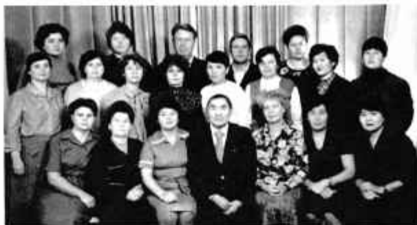
Коллектив энергосбыта, 1980 г.