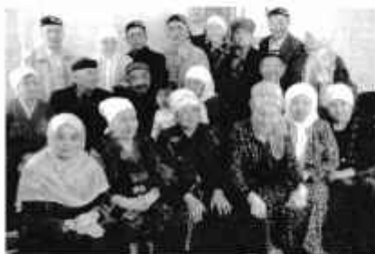
На встрече с членами Лиги женщин-мусульманок