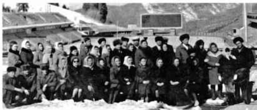
Коллектив винзавода на катке Медео Алма-Ата. 1974 г.