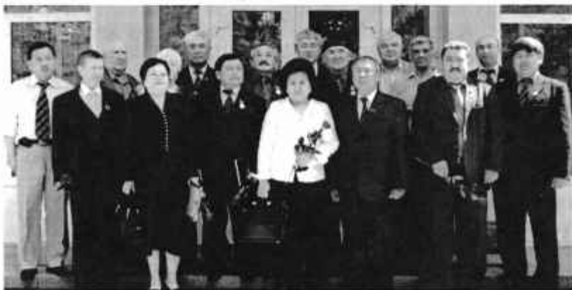
После награждения в честь 50-летия города