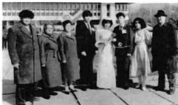
Свадьба дочери Майры и Кыстау