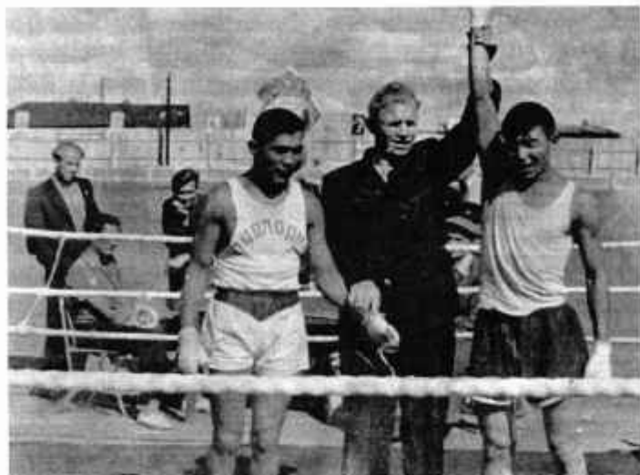
Чемпион Павлодарской области 1957 г.