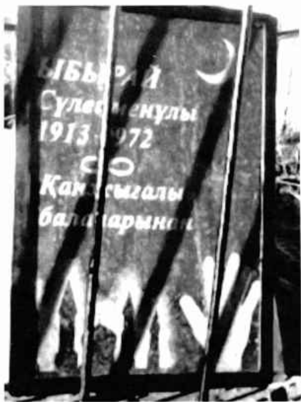
Плита на могиле отца