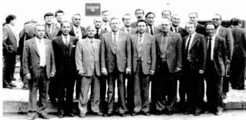
Энергетики Павлодарской области