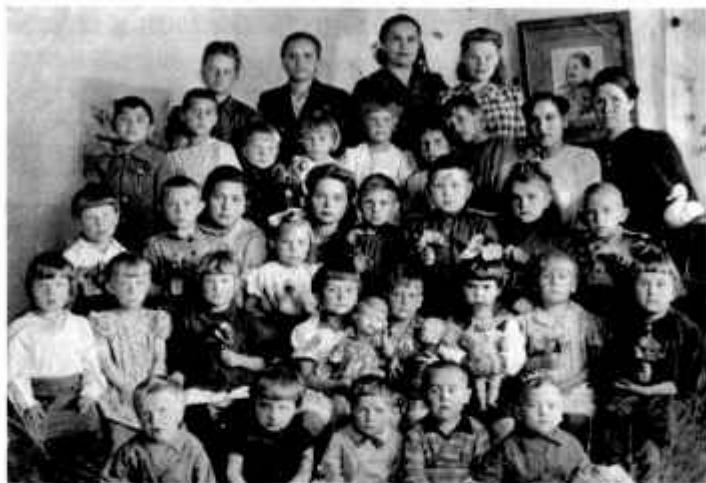
В городе Павлодар, 1946 г.