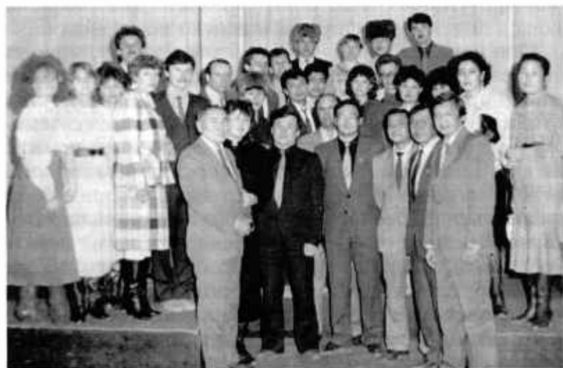
Участники юбилея 70-летия комсомола