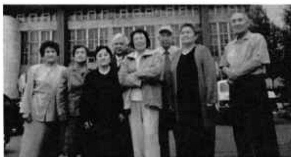
Друзья студенческих лет в гостях