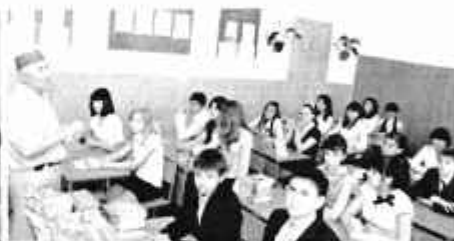
1 сентября в школе № 35