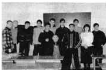
С учащимися колледжа ЕИТИ