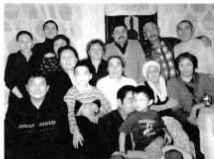
Встреча гостей из Катон-Карагая