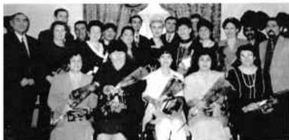
Коллектив энергонадзора, 1998 г.