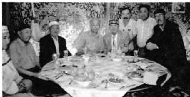
На день празднования Наурыза