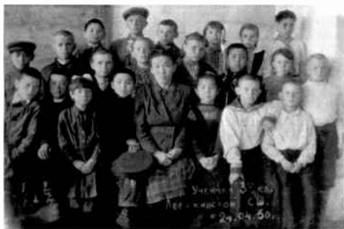
Село Лебяжье, 1950 г.