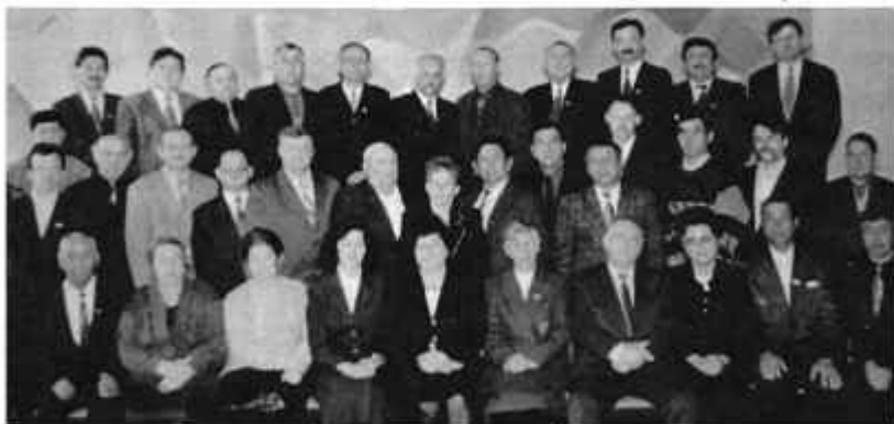
I созыв городского маслихата