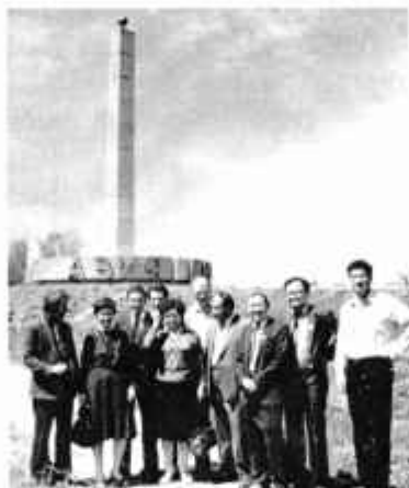
Граница между Азией и Европой. Представители энергонадзора Узбекистана, Киргизии, Тамбова, Казахстана.