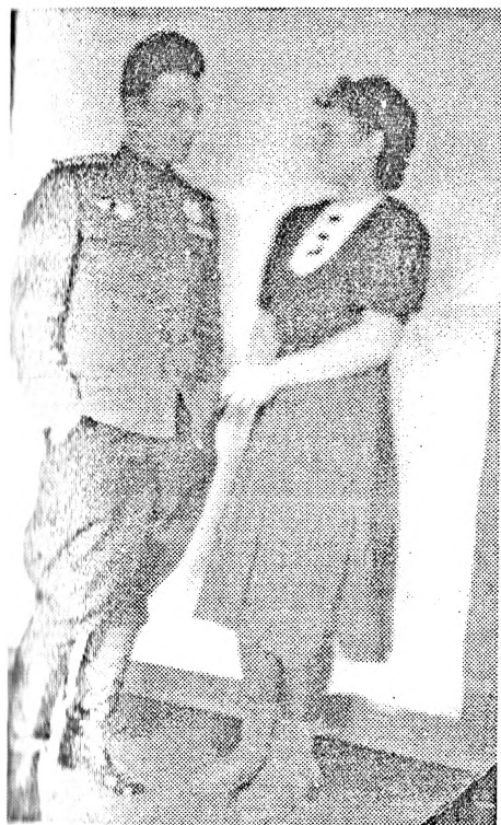
1946 г. Австрия

После чего добавляет: «Ну ладно, давайте отдыхать, квартира вас уже ждет». Это нас больше всего обрадовало. Идем на его машине в небольшой городок Маутерн, на берегу Дуная. Пересекаем мост понтонный, который построили бойцы Конева (так написано на табличках, установленных у моста).