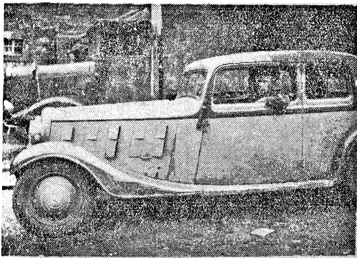
Конец войны. Германия