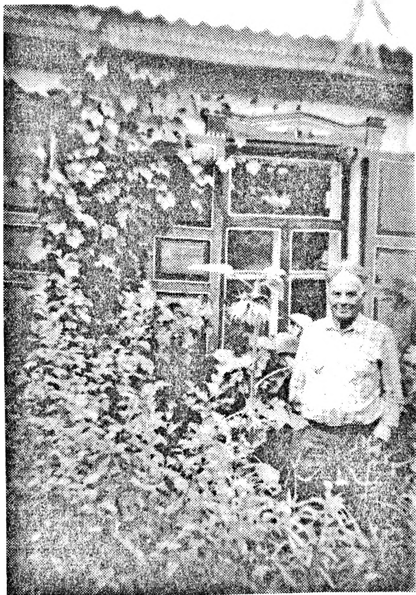
Лето 1991 г. У родного дома...

день посетили Диараму освобождения Севастополя на Сапун-горе. Со смотровых площадок нам видны те места, где были наши огневые точки, откуда наши орудия вели сокрушающий огонь по врагу. По их дзотам и дотам, по пехоте. Каждый из нас стоял и словно бы видел за голубизной этого мирного неба то далекое, что пришлось пережить. Видели закопченные уста-