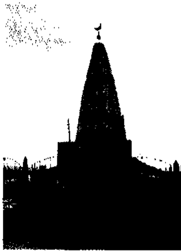
Мемориальный памятник на месте захоронения Бухар-жырау

К 20 августа 1993 г. в урочище Садык был раскинут городок из сотни белых юрт. На праздник юбилея Бухар-жырау приехали гости из всех областей Казахстана, а также из дальнего и ближнего зарубежья. 21 августа здесь было торжественное открытие монументального мемориального комплекса, сооруженного на могиле Бухар-жырау, который включает в себя мавзолей, клуб с музеем, коттеджи, котельную, автомобильные и вертолетные стоянки. Мемориальный комплекс построен по проекту института «Карагандаагропроект». А затем в течение