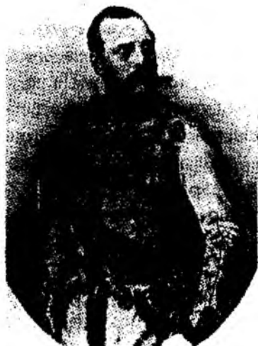
Император России Александр II (1818-1881 гг.)

Оплавав горестную кончину драгоценного нашему сердцу Его Императорского Высочества наследника Цесаревича и Великого князя Николая Александровича, мы с глубокою грустью в сердце, непрестанно возносим теплые молитвы наши к Господу Богу о вечном его успокоении.