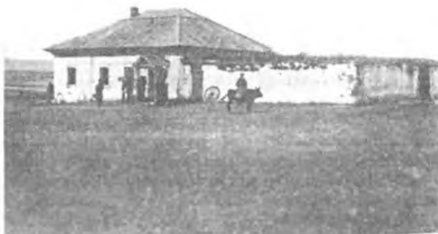
Пикет Джамантуз. Фотография 1905 г.

Так что, может быть, кто-то из местных предпринимателей задумается о возможности открытия на озере Калкаман современной грязелечебницы.