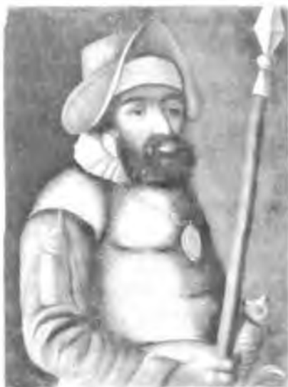
Портрет Ермака Тимофеевича. Неизвестный западно-европейский художник начала XVIII века

Кучума; верным слугой русского царя, таким русским борцом против угнетателей местных племен Сибири, названным русским народом «меньшим братом Ильи Муромца»; другая группа авторов выступает с диаметрально противоположной оценкой и считает его атаманом бродячей шайки казаков-завоевателей земли исконных жителей Сибири.