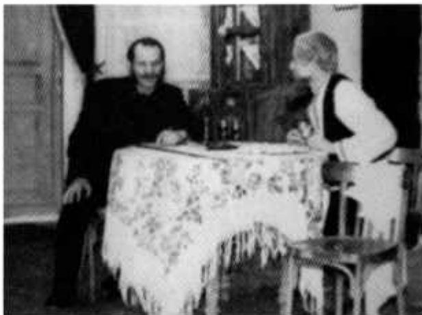
Солодарь «Груз особого назначения»