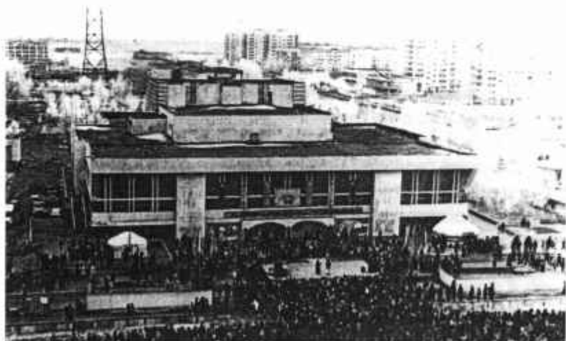
Мы встречаем Наурыз

с уверенностью сказать, к началу празднования «Наурыза» всё будет готово.