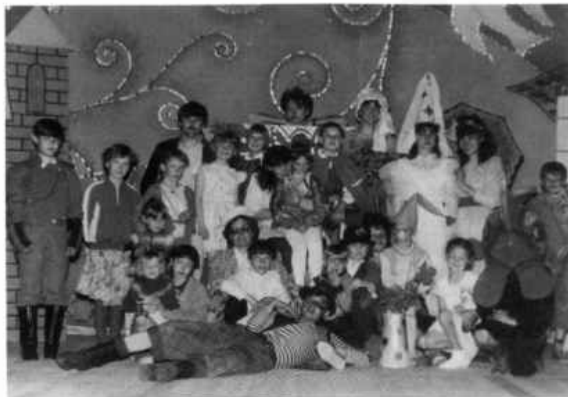
«В гостях у феи Здравствe»