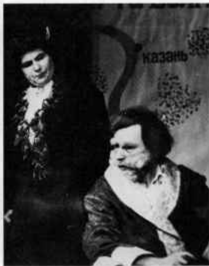
М. Горький «Васса Железнова»