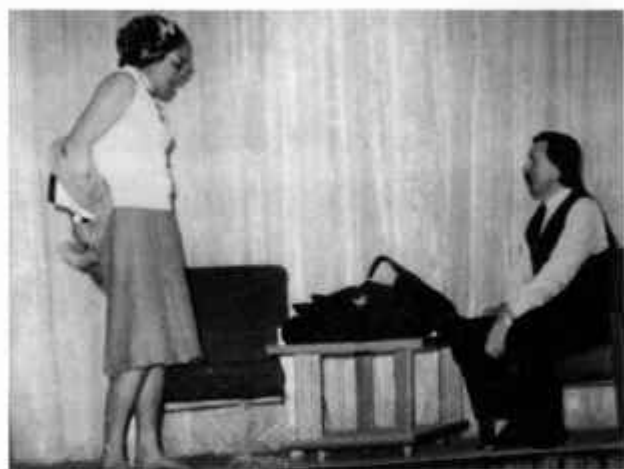
В.М.Шукшин «Энергичные люди»