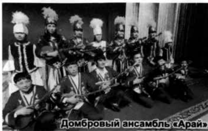
Домбровый ансамбль «Арай»