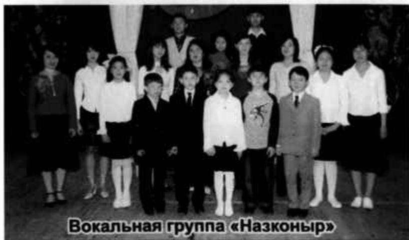
Вокальная группа «Назконыр»