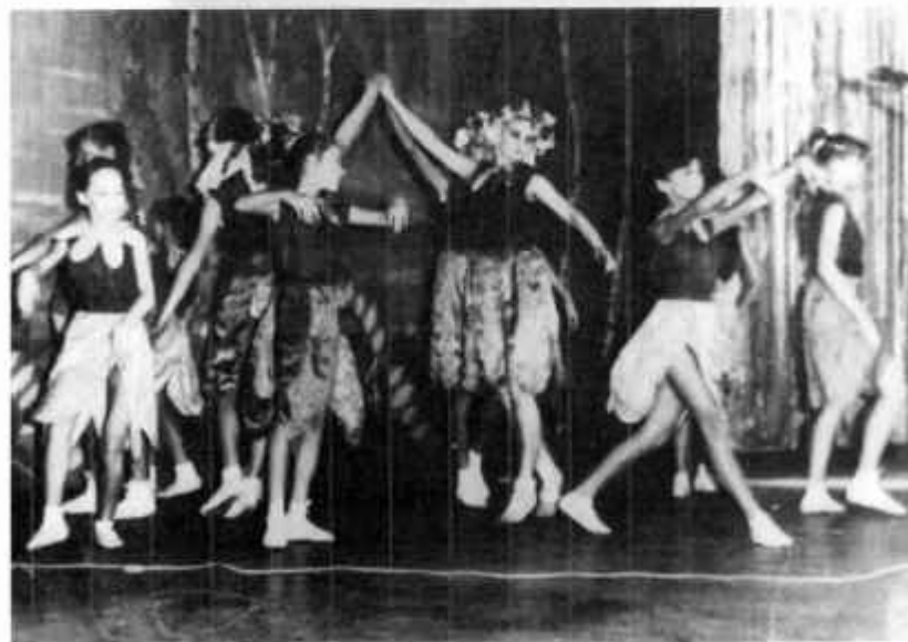
«В гостях у феи Здравствe»