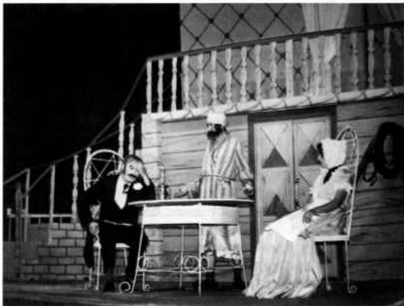
А.П. Чехов «Я замуж хочу»