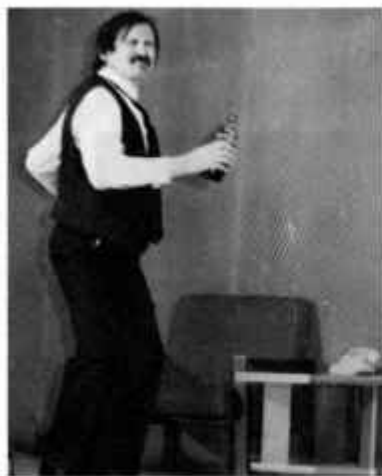
В.М.Шукшин «Энергичные люди»