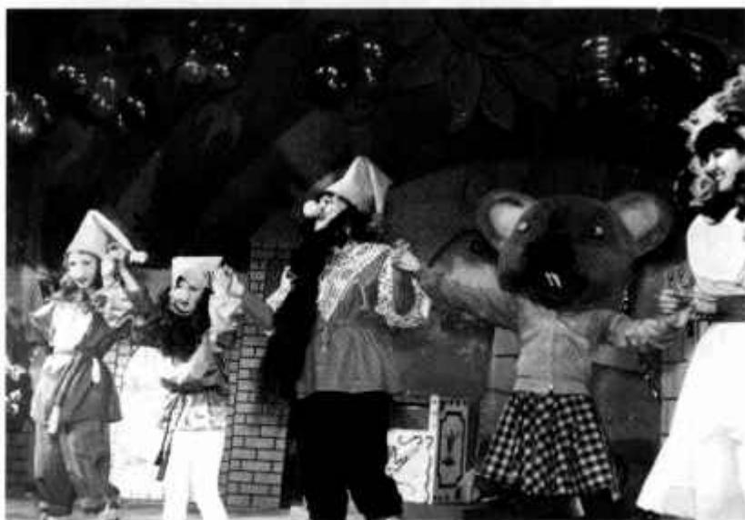
Совместное мероприятие художественных коллективов ДК, культурно-массового отдела театральных студий