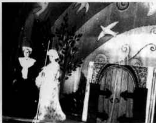
«Кот в сапогах»