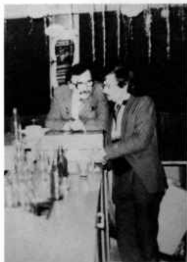
Чёкин. «Последняя встреча»