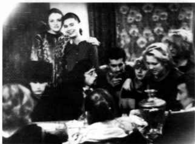
Коллектив театра «Данко»