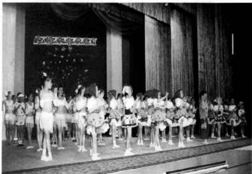
Отчётный концерт коллектива