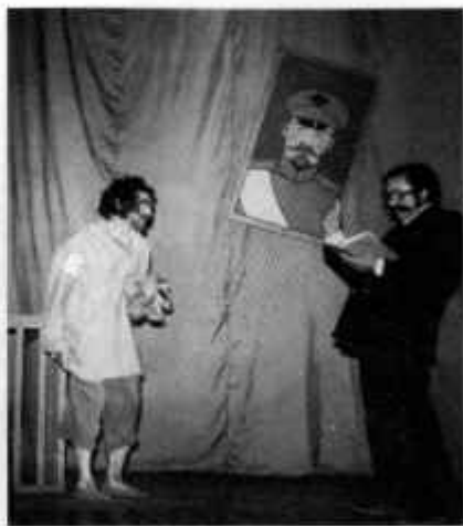
А.П. Чехов «Злоумышленник»