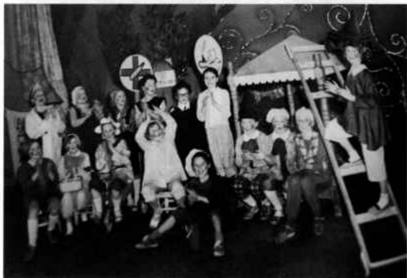
Шварц. «Снежная королева»