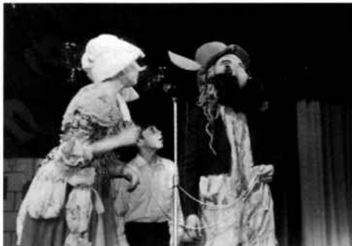
«В гостях у феи Здравсте»