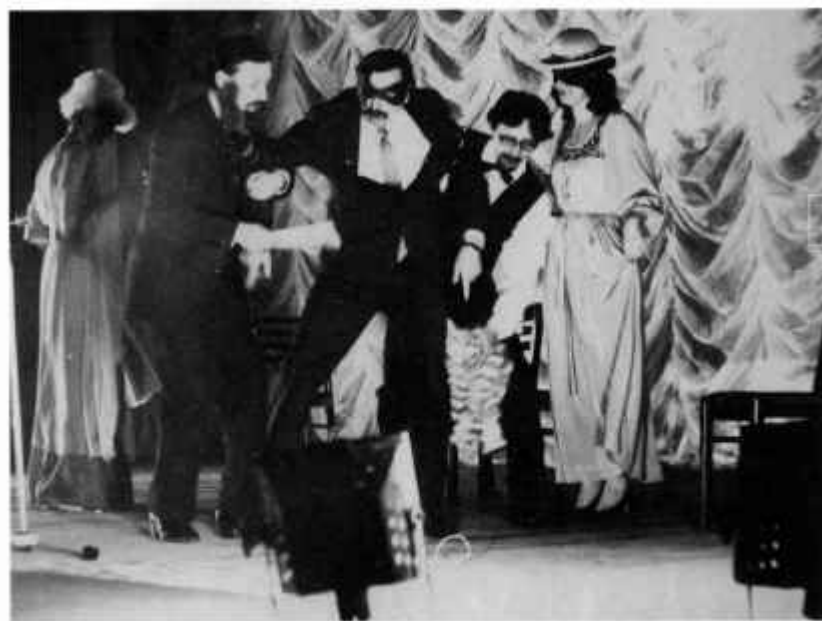
А.П. Чехов «Юбилей»