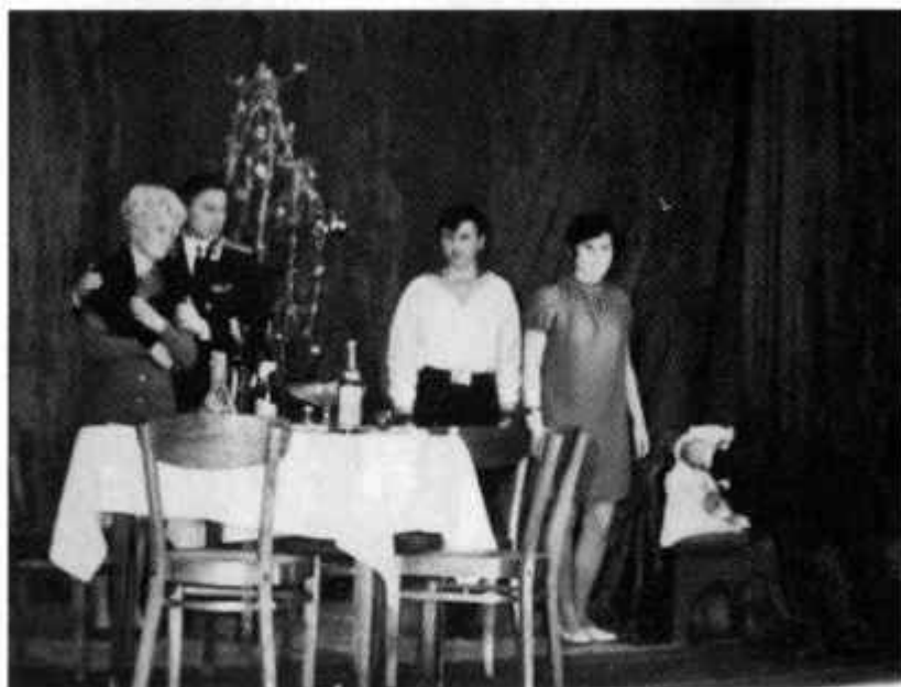
И. Эвальд «Семья Воронова»