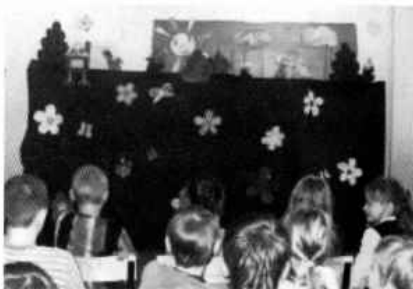
«Вырастил дед репку»