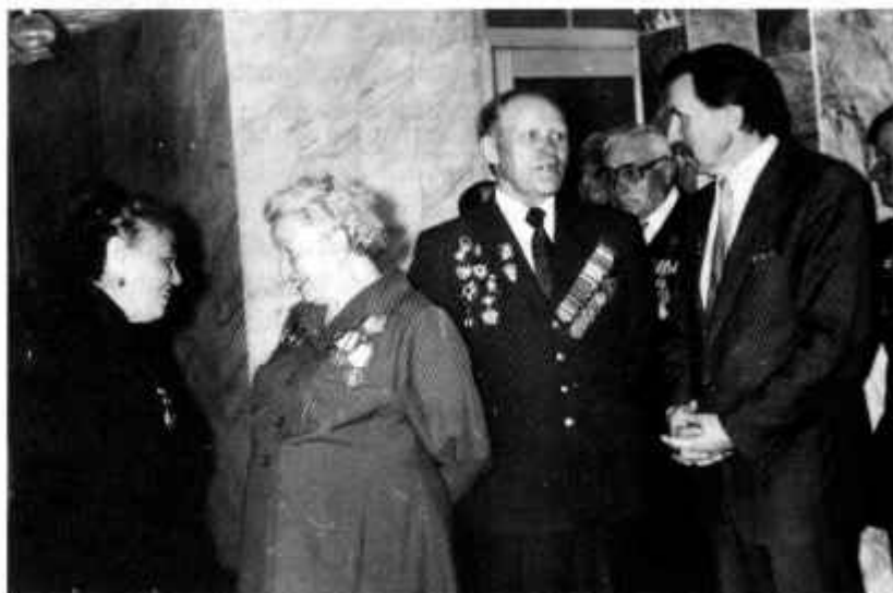
Вечер «Где же Вы, друзья однополчане»

он работал в ДК аккомпаниатором хора «Красная гвоздика», а до этого начальником участка ДК.