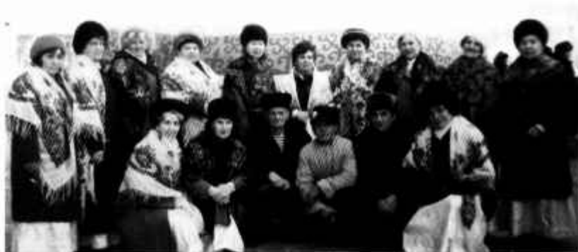
Хор «Красная звезда»