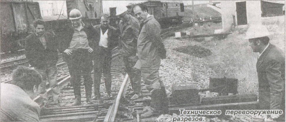
Техническое перевооружение разрезов.